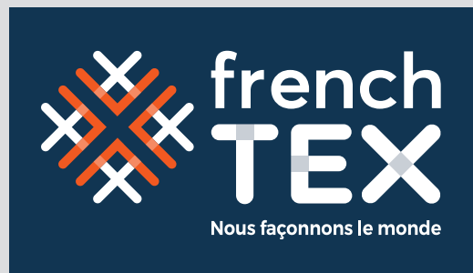
Version 1 couleur & blanc